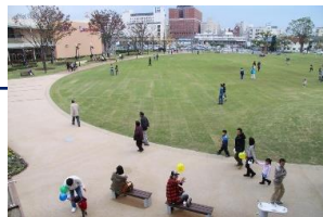
多目的広場ゾーン