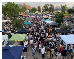
イベント交流ゾーン