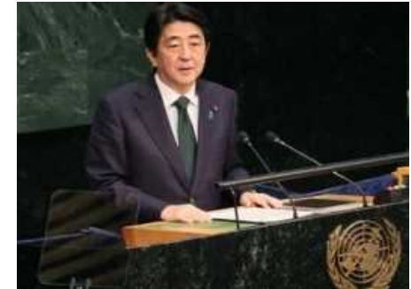
SDGsを採択した国連サミットで演説する安倍総理(2015年9月)