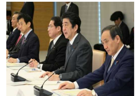
SDGs推進本部会合 (2016年12月)

6月9日 第3回SDGs推進本部会合を開催。企業や団体等の先駆的な取組を表彰する「ジャパンSDGsアワード」の創設を決定。