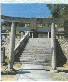
道真ゆかりの 琴浦天満宮