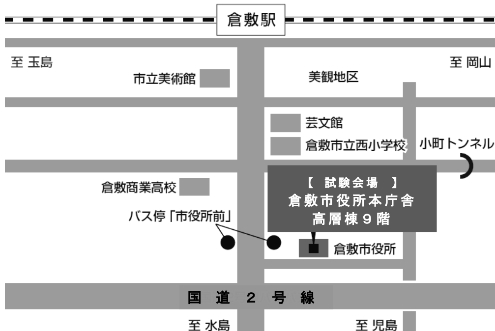
（試験会場周辺拡大図）

自動車・・・下図（試験会場周辺拡大図）の受験者駐車場へ駐車（満車の場合は屋内駐車場へ）